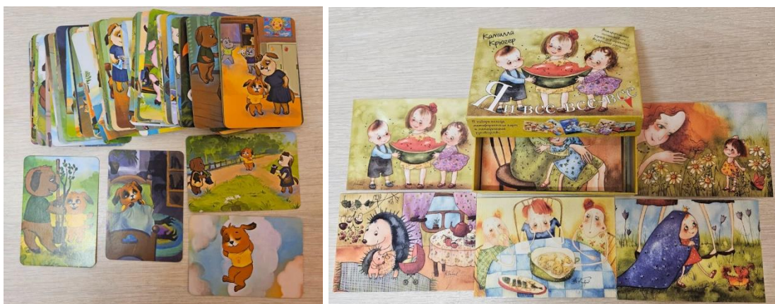
МАК «Дружок» МАК «Я и все-все-все-все»

Например, дети могут описывать детали на картинках или загадывать её для других участников. Описывают героев с точки зрения, какой он, что делает. Сочиняют коллективные истории. Придумывают названия картам.