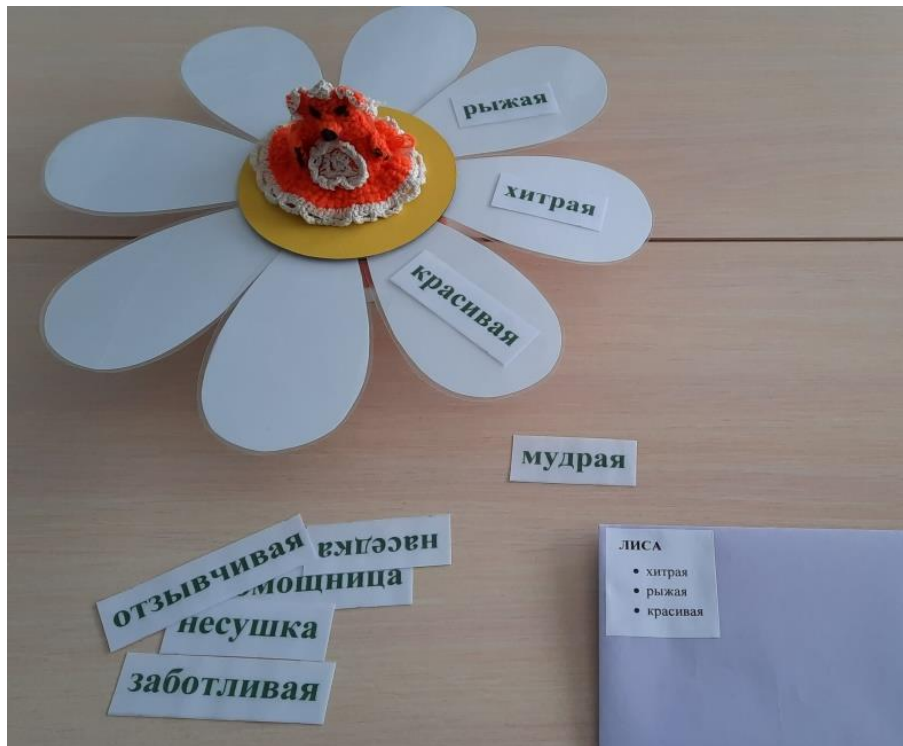
Рисунок 5. Вид дидактического пособия при варианте применения № 2 в процессе использования.