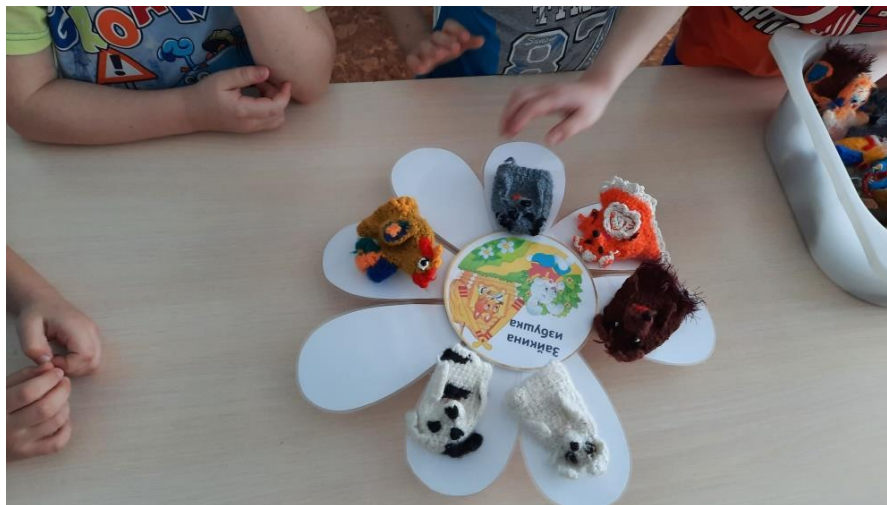
Рисунок 8. Вид дидактического пособия при варианте применения № 4 в процессе использования.