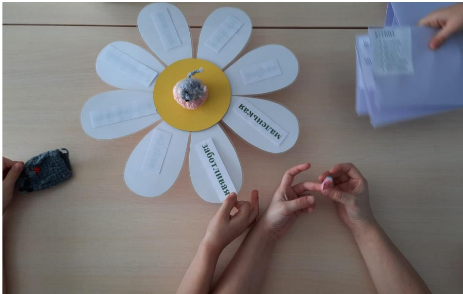
Рисунок 6. Необходимые элементы дидактического пособия для варианта применения № 3 для детей среднего и старшего дошкольного возраста.