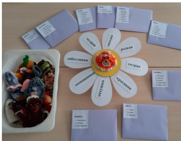
Рисунок 4. Необходимые элементы дидактического пособия для варианта применения № 2 для детей среднего и старшего дошкольного возраста.