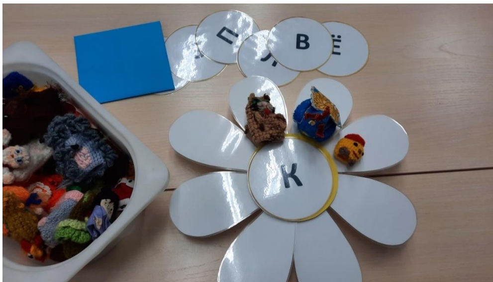
Рисунок 13. Необходимые элементы дидактического пособия для варианта применения № 8 для детей среднего и старшего дошкольного возраста.