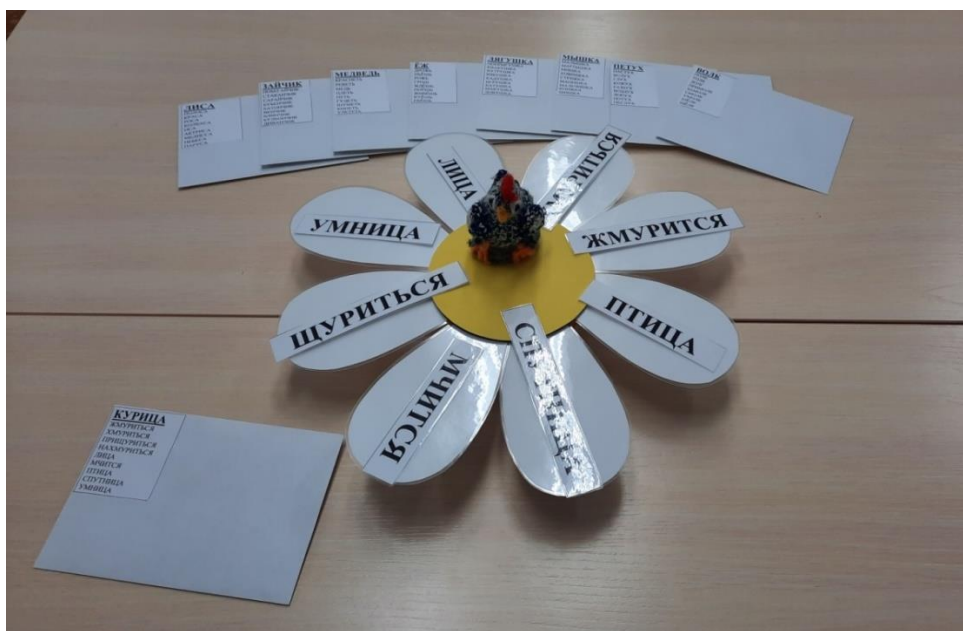
Рисунок 12. Вид дидактического пособия при варианте применения № 7 в процессе использования.