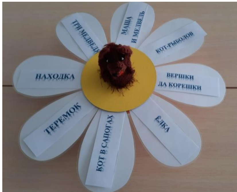
Рисунок 3. Раскладка элементов дидактического пособия для варианта применения № 1 для детей старшего дошкольного возраста.