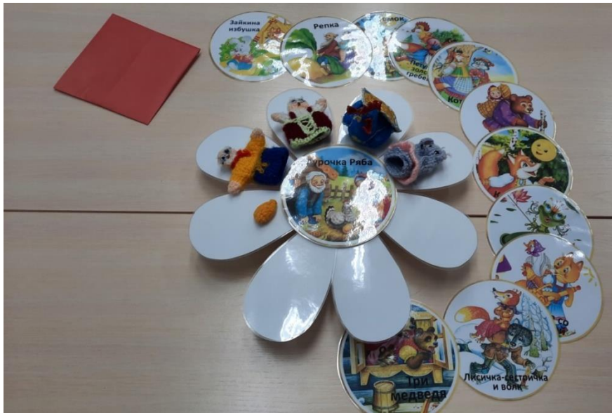
Рисунок 7. Необходимые элементы дидактического пособия для варианта применения № 4 для детей среднего и старшего дошкольного возраста.