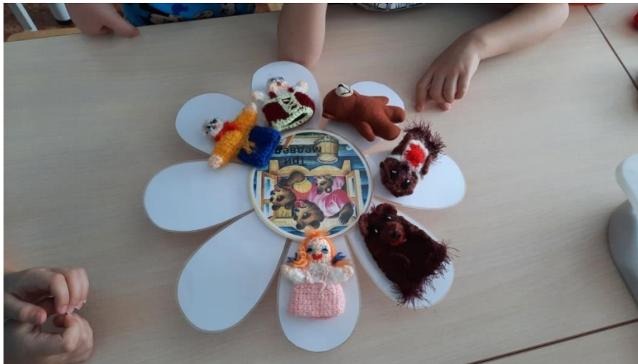
Рисунок 9. Вид дидактического пособия при варианте применения № 5 в процессе использования.