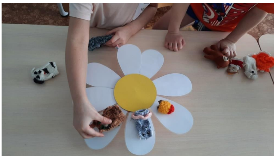
Рисунок 10. Вид дидактического пособия при варианте применения № 6 в процессе использования.