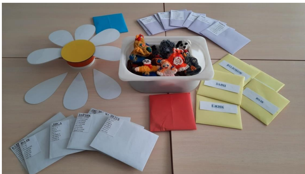
Рисунок 1. Дидактическое пособие «Сказочная ромашка» в разложенном виде.

Краткое описание дидактического пособия «Сказочная ромашка» по развитию речи и театрализации для детей среднего и старшего дошкольного возраста.