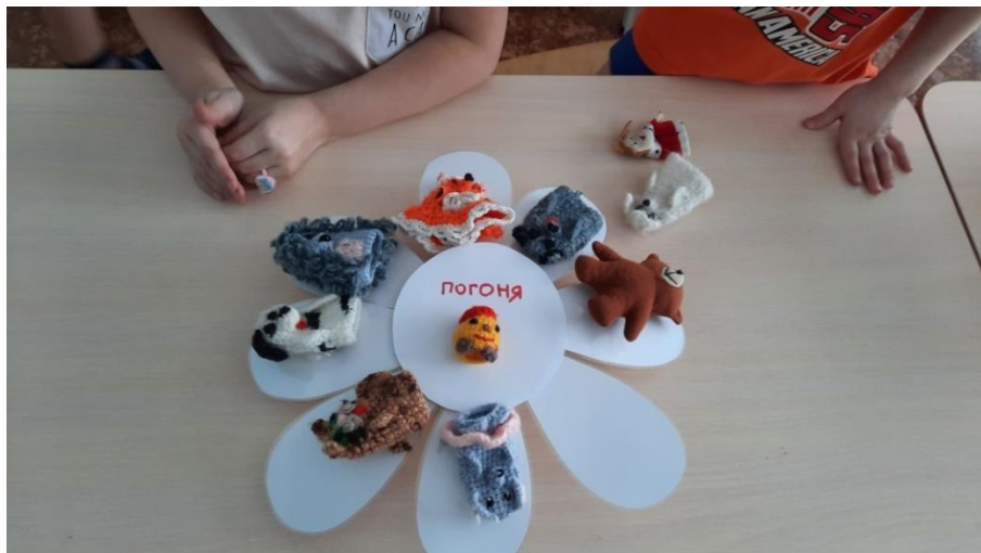
Рисунок 11. Вид дидактического пособия при варианте применения № 6 в процессе использования.