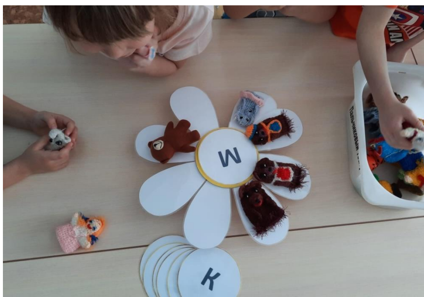
Рисунок 14. Вид дидактического пособия при варианте применения № 8 в процессе использования.