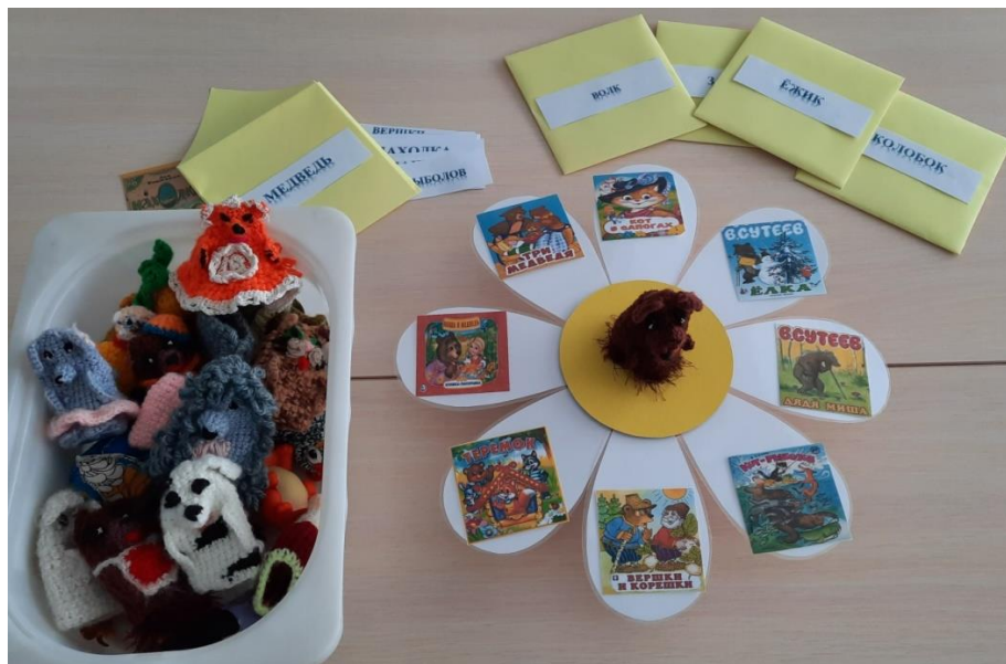
Рисунок 2. Необходимые элементы дидактического пособия для варианта применения № 1 для детей среднего дошкольного возраста.