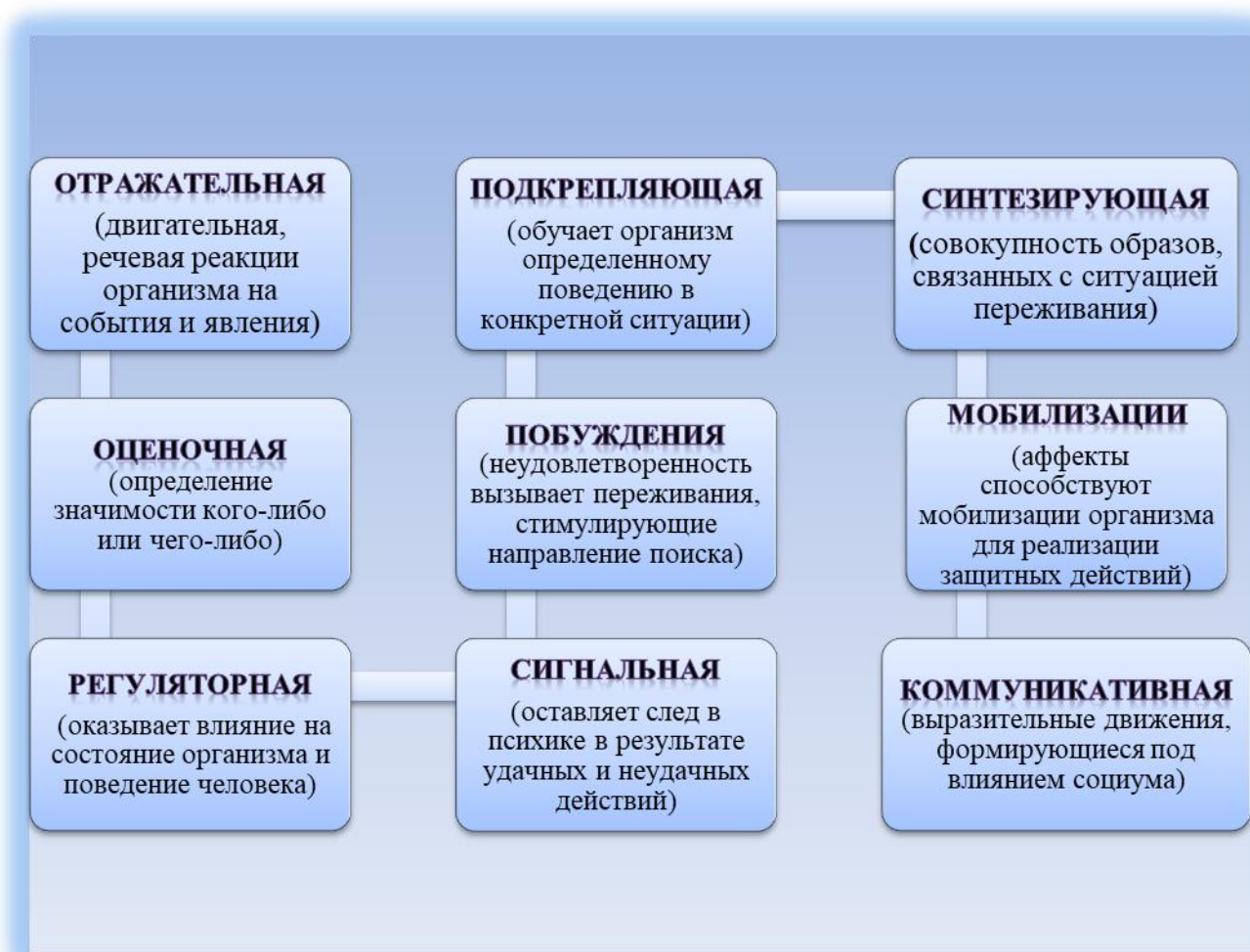
Рис. 3 Функции эмоций

Астенические – уменьшают активность. энергию человека. В процессе длительного филогенетического развития эмоции приобрели большое количество функций. Функции эмоций: