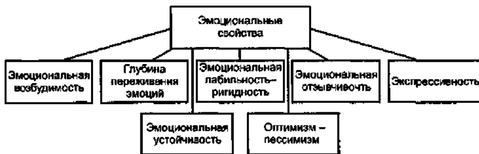
Рис. 4.1 Эмоциональные свойства человека

Характеристики эмоционального реагирования, постоянно и ярко проявляющиеся у данного человека, являются его эмоциональными свойствами. Их состав представлен на рис. 4.1