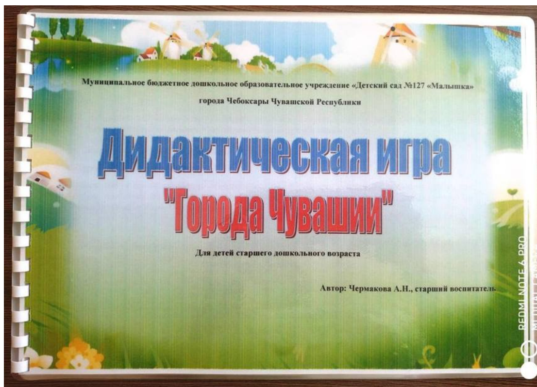
Фото дидактической игры «Города Чувашии»

Игра 4: Педагог называет город Чувашии, дети находят картинку и страницу в альбоме с описанием данного города и т.д.