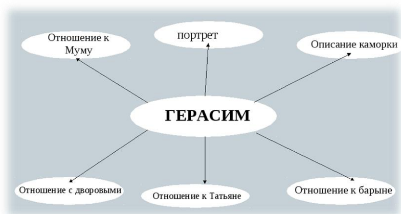
Схема 1. Кластер по рассказу Л.Н. Толстого «Муму»

Данный приём позволяет визуализировать мыслительный процесс обучающихся, активизировать их познавательную и творческую активность, развивать интерес к изучению литературы, добиваться качественных предметных результатов как в познавательной сфере, так и в ценностно-ориентационной.