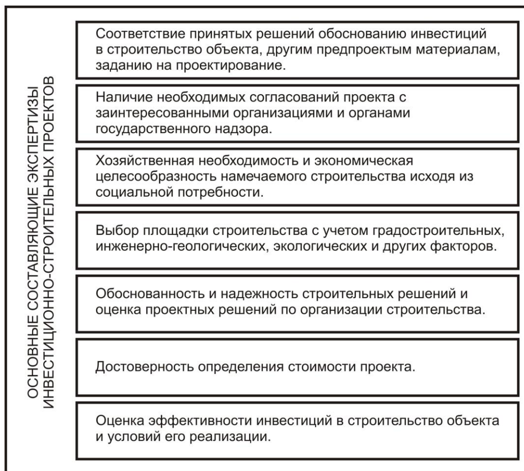
Рисунок 2 – Основные составляющие экспертизы инвестиционно-строительных проектов

учитывающую технико-организационные, финансовые, трудовые и материальные и иные ресурсы, распределяемые в ходе принятия управленческих решений [3].