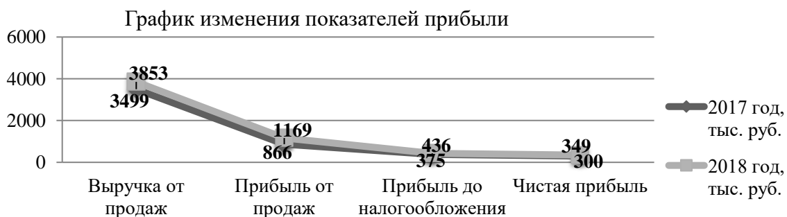
Рисунок 2 – График изменения показателей прибыли предприятия за 2017-2018 г.г.

По данным таблицы 2 построим график изменения показателей прибыли предприятия за 2017-2018 гг (рисунок 2) и диаграмму доли показателей прибыли от продаж в выручке за тот же анализируемый период (рисунок 3).