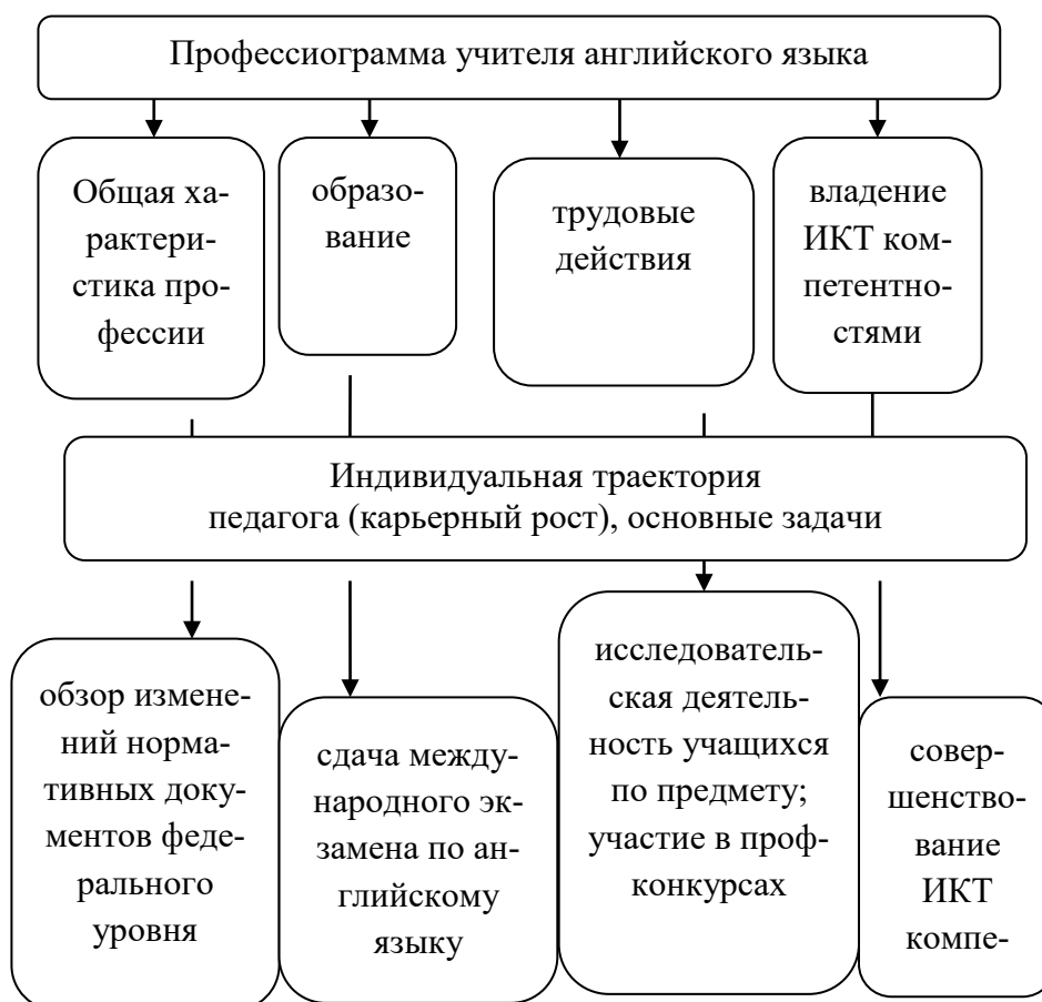
Рисунок 2. Прогноз индивидуальной траектории

Индивидуальная траектория движения учителя английского языка с точки зрения горизонтальной карьеры – продвижение внутри общеобразовательной организации (профессиональная карьера): учитель высшей квалификационной категории; карьера в области методики и практики преподавания английского языка: учитель инновационных технологий, руководитель методического объединения школы, председатель методсовета школы. Основные задачи педагога представлены на рис.2: