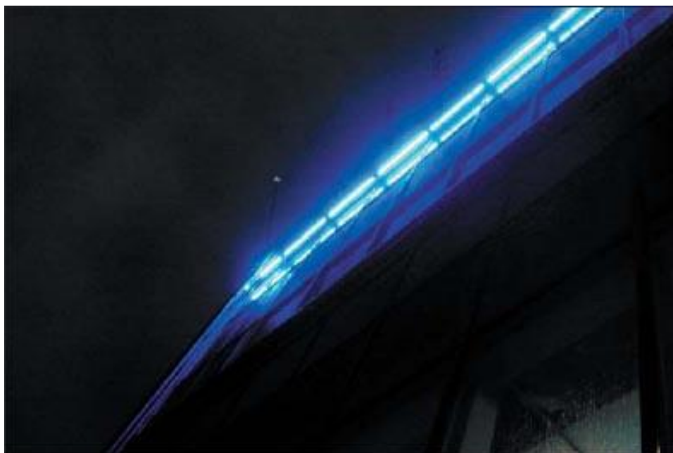
Рис.1. Фрагмент подсветки здания «Газпрома» с помощью светильников на основе светодиодов Cree