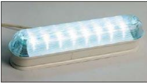
Рис. 4. Светильник для освещения в подъездах жилых домов

При этом на основании данных, приведенных в таблице 1, срок окупаемости СДС при замене ими КЛЛ составляет (для одного светильника) около 2 лет, а при замене ими ЛН — менее 4 месяцев.