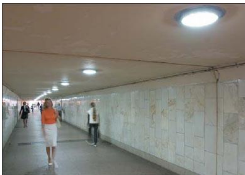
Рис. 2. Светильники ДВУ-25 на основе светодиодов Cree в подземном переходе в Москве

Для получения постоянного тока должно использоваться устройство со специальной электрической схемой — драйвер. Входное напряжение драйвера обычно выбирают из стандартного ряда номинальных значений: 12, 24 или 48 В. Для СДС, способных освещать помещение с высотой потолков 4 метра