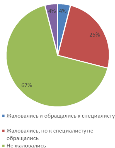
Рисунок 1 - Мнение родителей о нагрузке на ребенка и частота обращений с ребенком к специалистам

Среди детей, жалующихся на переутомление, (29% детей, среди которых те, с которыми обращались к специалисту, и те, с которыми к специалисту не обращались) с репетитором, в кружках или секциях занимаются 22% детей. Среди детей, не жалующихся на переутомление, (71% детей, среди которых те, с которыми обращались к специалисту, и те, с которыми к специалисту не обращались) с репетитором, в кружках или секциях занимаются 45% детей.