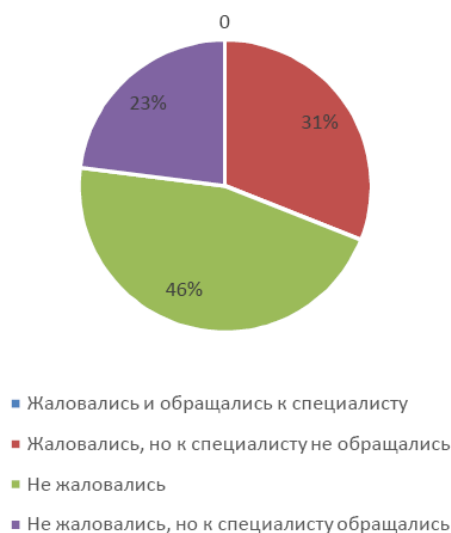
Рисунок 2 - Мнение родителей о нагрузке на ребенка и частота обращений с ребенком к специалистам

Среди детей, жалующихся на переутомление, (29% детей, среди которых те, с которыми обращались к специалисту, и те, с которыми к специалисту не обращались) с репетитором, в кружках или секциях занимаются 22% детей. Среди детей, не жалующихся на переутомление, (71% детей, среди которых те, с которыми обращались к специалисту, и те, с которыми к специалисту не обращались) с репетитором, в кружках или секциях занимаются 45% детей.