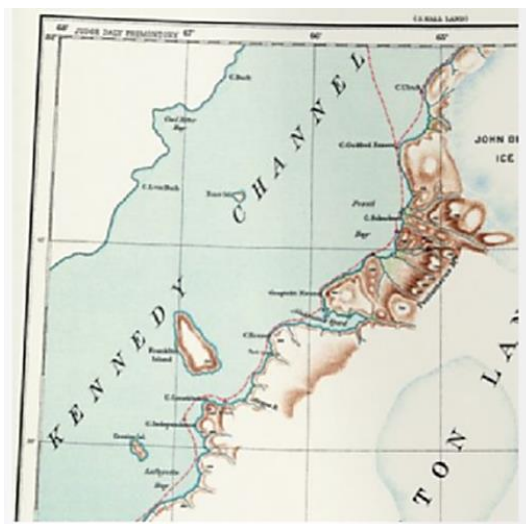
Рис. 2.1 Фрагмент “Саре Constitution”, лист 11 топографической карты Северной Гренландии, изображающий остров Ганса. [6]