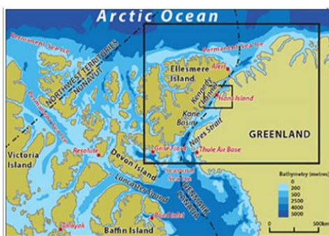
Карта, показывающая расположение острова Ганса относительно Гренландии и острова Элсмир [23]

Рассматриваемый в рамках работы конфликт - локальный по пространственно-географической типологии, т.к. все описываемые в данной аналитической справке события происходили (и происходят до сих пор) на территории острова Ганса.