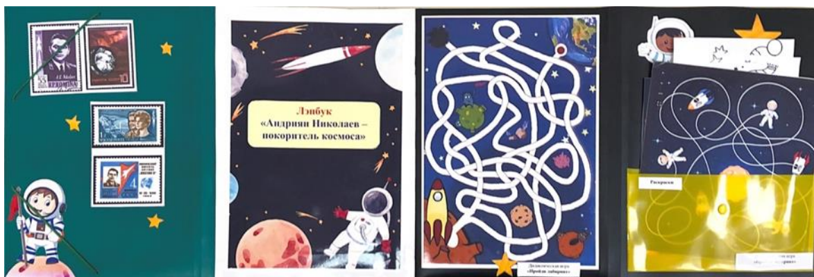
Рисунок 1. Титульная сторона лэбука