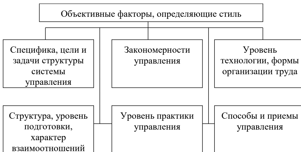
Рис. 2. Объективные факторы, определяющие стиль руководства

Эффективность управленческой деятельности во многом зависит от руководителя, от его способностей.