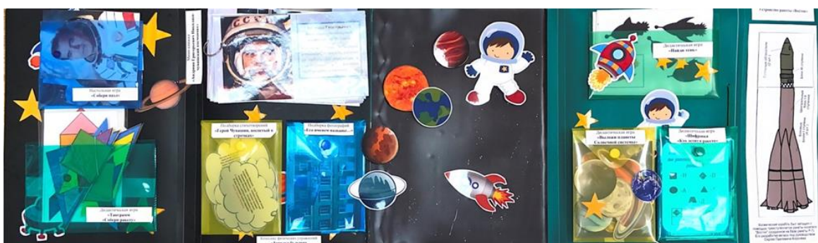
Рисунок 2. Внутренняя сторона лэбука

Методические рекомендации по использованию ЛЭПБУКА: