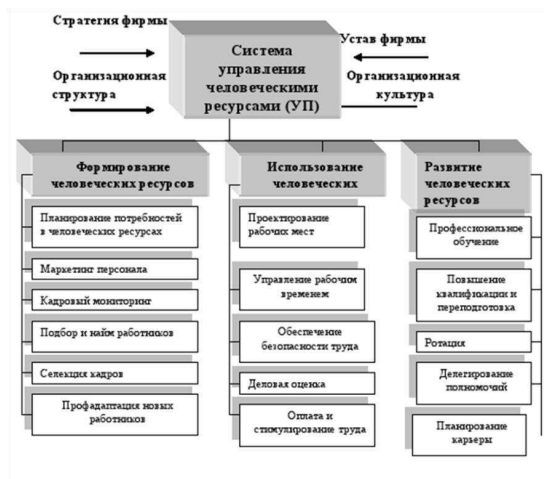
Рис.1 Система управления человеческими ресурсами

Стимулировать персонал нужно постоянно, потому что эффективности работы еще нужно добиться при помощи постоянного обучения и эффективной материальной мотивации. Государственный служащий при этом не должен ни в чем нуждаться хотя бы для того, чтобы не создавались условия для коррупции. Именно по этой причине процесс стимулирования труда нельзя назвать простым, потому что наилучшим его результатом является то, что государственный служащий с удовольствием повышает свою квалификацию, занимается самообразованием, эффективно и быстро решает различные вопросы, защищает интересы страны, региона [4, С.160-164].