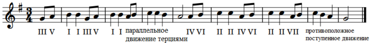
Рис. 3. Норвежская песня

восприятию на слух в предварительном анализе мелодического движения обязательно будут участвовать понятия: косвенное, противоположное и параллельное голосоведение, «золотой ход валторн».