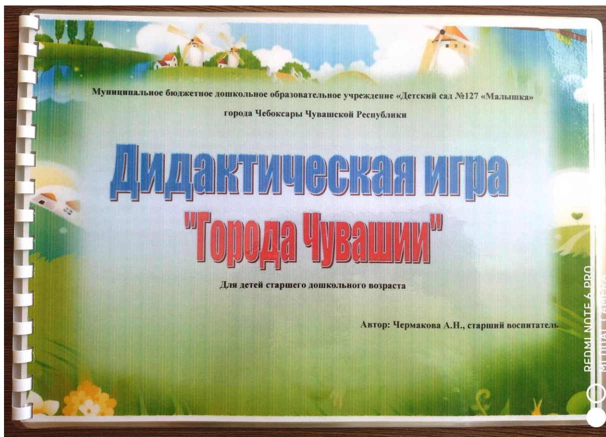
Фото дидактической игры «Города Чувашии»