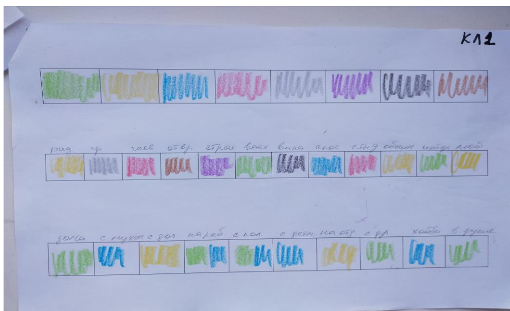
Рис.1 Рисуночный тест "Домики"

Обязательно обращается внимание на процедуру раскрашивания: как выбирает цвета (быстро не задумываясь, обдумывает, меняет решения, другие варианты), закрашивает домики целиком или делает пометки, закрашивает все в одном стиле или меняет направление штриховок, какими комментариями сопровождается раскрашивание и т.д. При этом первый ряд (ранжирование цветов) будет жестко фиксированным по количеству – 8 позиций, а второй и третий ряды в процессе диагностики предлагаем расширять по мере необходимости. Так, например, если воспитатель, заполняя предложенные психологом варианты чувств и эмоций, не отразил какой-то из цветов, то начинается поиск эмоций (чувств), которые могли бы соответствовать этому цвету путем подбора: предлагаем варианты и смотрим, какой цвет используется. Так до момента попадания. При этом клиент в процессе диагностики должен быть уверен, что все идет по регламенту, чтобы избежать тревожности. А вот в третий ряд, отражающий жизненные сферы, можно помимо интересующих нас сфер, связанных с ДОУ, добавлять любые сферы важные для педагога, открыто спрашивая его.