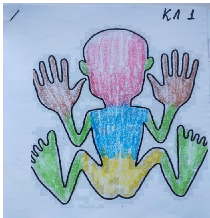
Рис. 2. Рисуночный тест "Гомункулюс"

2. Рисуночно-цветовое обозначение зон тела. Диагностическая методика "Гомункулюс" проективная методика А.В.Семенович [2], разработанная для выявления соматических проявлений и нарушений. При этом мы предлагаем использовать ее в дополнение к "домикам" в качестве второй части диагностики с использованием тех же восьми цветов для раскрашивания. И это уже будет диагностикой соматического состояния, а точнее эмоциональной наполненности тела, что в дальнейшем может привести к появлению соматических проблем (рисунок 2).