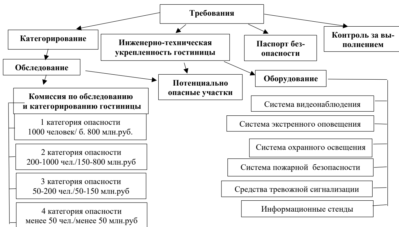
Рисунок 1. Требования к обеспечению антитеррористической защищенности гостиничного предприятия

В 2013 году вступил в силу Федеральный закон об антитеррористической защищенности объектов, согласно которому Правительство РФ получает право устанавливать обязательные к выполнению всеми юридическими лицами требования по антитеррористической защищенности объектов. В соответствии с ним Постановлением Правительства РФ № 447 от 14.04.2017 г. «Об утверждении требований к антитеррористической защищенности гостиниц и иных средств размещения и формы паспорта безопасности этих объектов» были введены требования к антитеррористической защищенности гостиниц. [2] (Рис. 1)