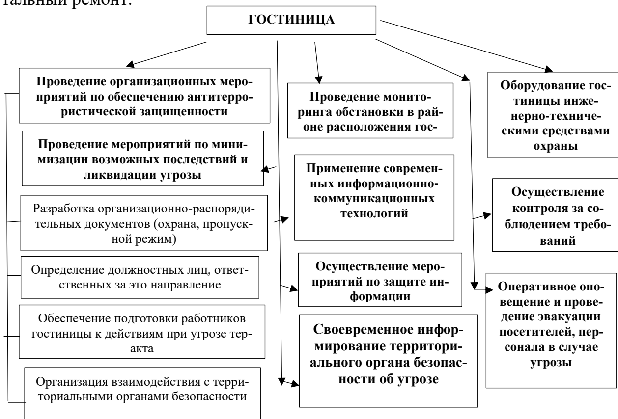
Рисунок 2. Деятельность гостиницы по обеспечению антитеррористической защищенности предприятия

На таких объектах антитеррористическая безопасность предусматривает использование всех необходимых методов и средств, которыми можно было бы минимизировать или исключить возможность совершения террористических актов. Инженерная защита гостиниц осуществляется в соответствии с Федеральным законом "Технический регламент о безопасности зданий и сооружений" на всех этапах их функционирования (проектирование (включая изыскания), строительство, монтаж, наладка, эксплуатация, реконструкция, капитальный ремонт).