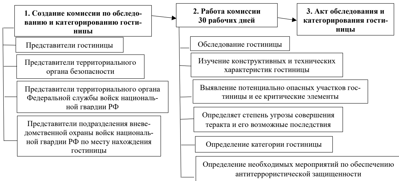
Рисунок 3. Порядок работы комиссии по обследованию и категорированию гостиниц

Необходимо отметить, что обеспечение безопасности туристов в гостинице не менее важный аргумент при выборе отеля чем уровень комфорта и сервиса, поскольку любой, даже небольшой инцидент, произошедший в гостинице, может отпугнуть гостей при выборе места проживания во время путешествия. Причем в данном случае будет оцениваться не сам факт происшествия, а действия сотрудников отеля в тот момент и меры, которые были предприняты для предотвращения или устранения последствий, то есть не столько технические средства безопасности, сколько поведение персонала.