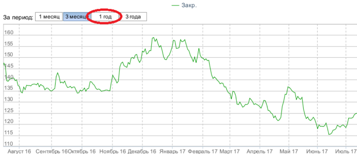
Рисунок 3 – Динамика акций Газпрома за год

А теперь рассмотрим последний график, где данные представлены за целый год. Период: 01.07.2016 г. – 01.07.2017 г. (рисунок 3).