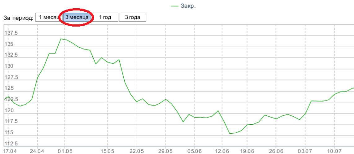
Рисунок 2 – Динамика акций Газпрома за три месяца

Далее давайте рассмотрим изменение курса акции, только уже не за один месяц, а за три. Насколько изменятся прогнозы и действия инвестора, при использовании и анализе данной информации. Данные представлены за период с 17.04.2017 г. по 14.07.2017 г. (рисунок 2).