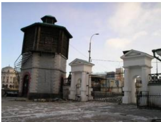
Рисунок 4. Водонапорная башня

Башня водонапорная (1880-е года) построена по типовому проекту в связи с организацией на месте механической фабрики и Монетного двора железнодорожных мастерских. С 1973 года башню используют как магазин сувениров. В 1972- 1973 годах в башне заменены все деревянные части, убран металлический бак. Находясь на линии восточной границы завода, башня доминирующим объемом акцентирует северо-восточный вход в Исторический сквер. Башня полуполюбокаменная, шестигранная, двухъярусная, с шестискатной кровлей и фонарем. Оба яруса на три стороны имеют проемы — по два оконных проема и по одному входному проему. Нижний ярус выполнен из гранитных блоков, угловые из них обработаны «под шубу». Верхний ярус из бревен, торцы которых защищены доской. Вход на 2-й ярус по наружной металлической лестнице.