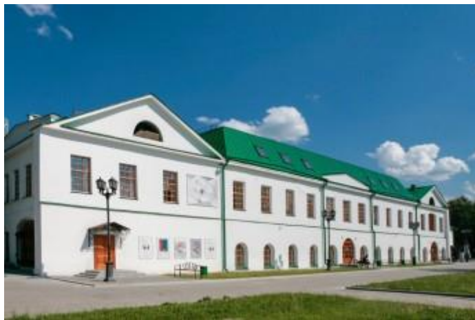
Рисунок 6. Музей архитектуры и дизайна УралГАХА

Надпись на мемориальной доске: Здесь в годы Великой Отечественной войны 1941-1945 гг. на заводе №50 (ФГУП "Уралтрансмаш") изготавливались узлы и агрегаты для танков Т-34, Т-60, и САУ.