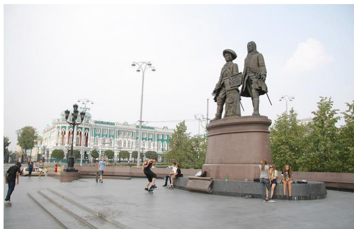
Рисунок 5. Памятник Татищеву и де Геннину

Памятник основателям Екатеринбурга находится в самом центре города, около Плотинки. На мой взгляд, это самый красивый памятник Екатеринбурга. Хотя многие краеведы восприняли его появление весьма неоднозначно. Причина в том, что в реальности отцы-основатели города были слишком не похожими людьми, а на памятнике они - словно братья.