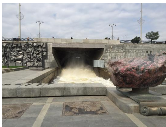
Рисунок 1. Плотина сегодня