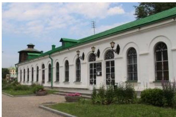
Рисунок 3. Музей природы Корпус малых кузниц.

Музей природы в Екатеринбурге - старейший отдел этого крупнейшего на Урале музейного объединения. Коллекция музея насчитывает около 60 тысяч экспонатов. Увидеть их все сразу не получится, некоторая часть либо находится на реконструкции, либо хранится в музейном фонде.