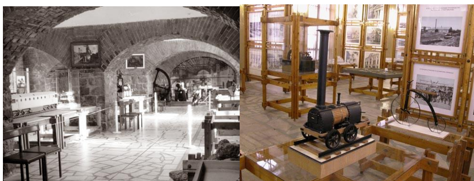
Рисунок 7. Экспозиции музея