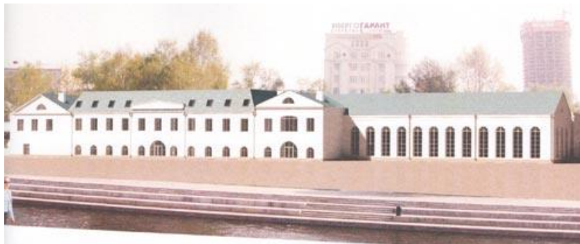
Рисунок 2. Набережная Плотинки

Долгое время при заводе работал Монетный двор, затем гранильная фабрика - украшавшая своими шедеврами экспозиции Эрмитажа и Лувра, в начале XIX века было организовано небольшое механическое заведение, переросшее в механическую фабрику – прообраз Уралмаша. А в 1878 году в заводских корпусах расположились главные мастерские Пермской железной дороги, позднее преобразованные в «Вагоноремонтный завод имени В.С. Воеводина». Немногие старожилы вспомнят, как прямо из ворот исторического сквера по улице Малышева двигались поезда.