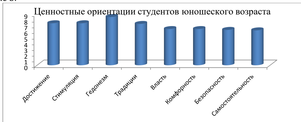
Рис. 3. Ценностные ориентации школьников

Наглядно ценностные ориентации студентов представлена на рисунке 3.