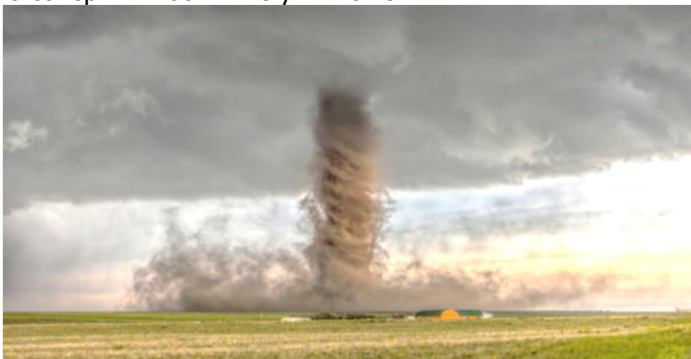
Рисунок – 1 Смерч

грозой, дождём, градом. Смерч по своей структуре является кратковременным, так как очень быстро холодный и тёплый воздух смешивается, и таким образом поддерживающее его основание пропадает. Даже за небольшой промежуток времени своего существования это завихрение способно совершить большие уничтожения.