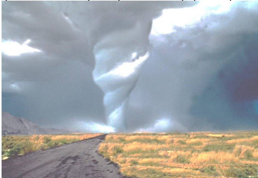
Рисунок – 2 Светящийся смерч

электромагнитных полях, предложил теорию шаровой молнии. В смерчах прослеживаются не только шаровые молнии, но и сверкающие тучи. Периодически светится вся нижняя часть облака. В 1968 году американскими учеными Б. Вонненгутом и Дж. Мейером было собрано и описано множество световых явлений в смерче. Свечения изнутри смерча сплетены с беспорядочными вихрями различной формы и размеров.